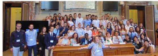
IO 1 - Joint Staff Training, Maynooth (IE), 23-26 July 2018